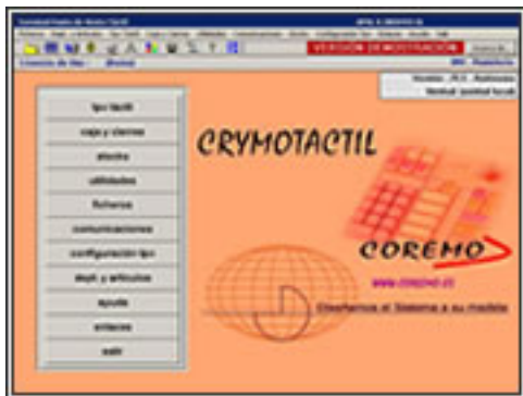
Programa para TPV Táctil

Es un conjunto de programas de gestión y venta creados y desarrollados para optimizar y maximizar los recursos de la tecnología táctil y con la gestión efectuada desde teclado.